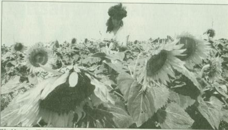
Közel harminc, Kisvárdá környéki település agrártermelőit szolgálja ki a kisvárdai iroda

— Segítünk a sokak által nem szeretett és kevésbé érthető ha-