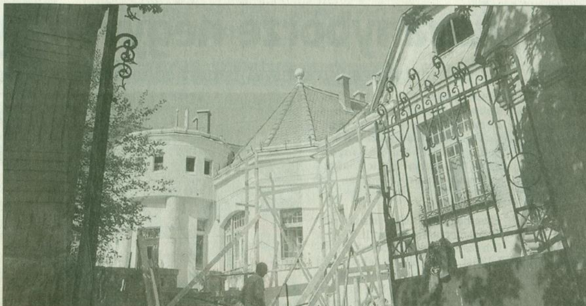
Bagolyvári reneszánsz Az évek során kibőjtölte új köntösét Kisvárdai Polgár egyik legérdekesebb épülete, a Bagolyvár