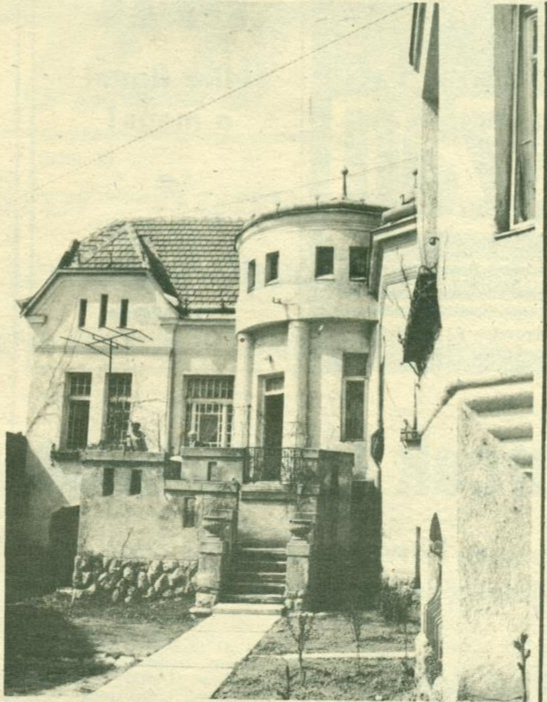
BAGOLYVÁR. A kisvárdaiak így hívják a Lenin út 59. szám alatt álló épületet.